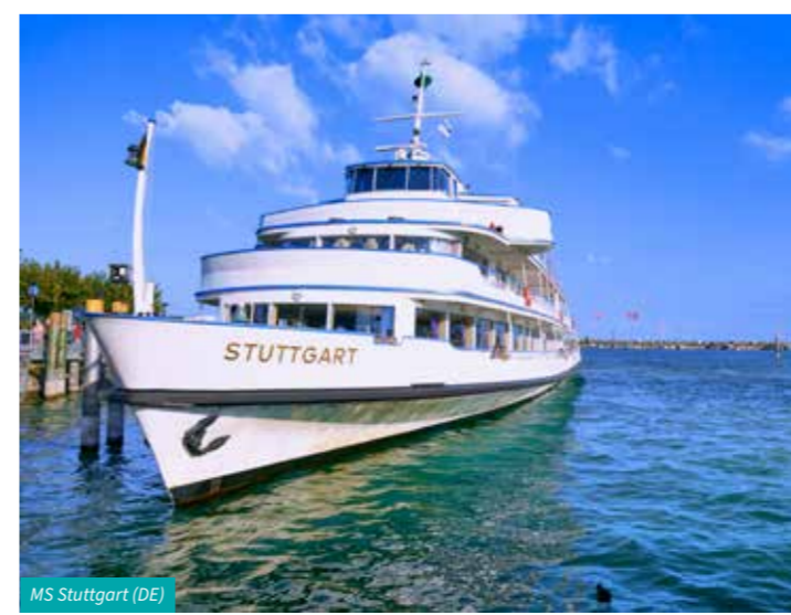
MS Stuttgart (DE)