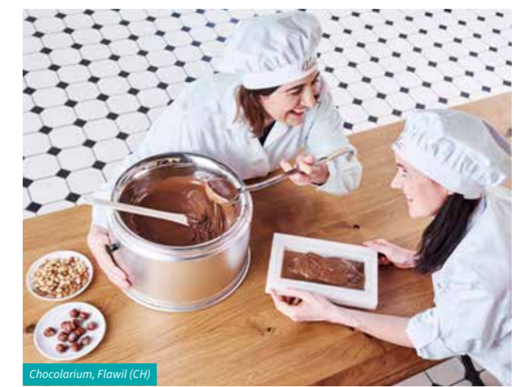
Chocolarium, Flawil (CH)