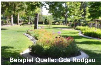
Beispiel Quelle: Gde Rodgau